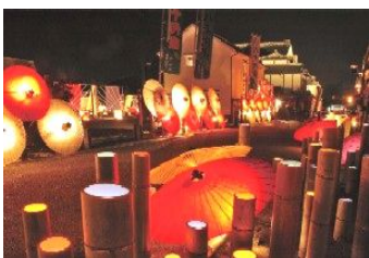
▲ライトアップされた通り

様々な形・大きさの灯籠のオブジェを通りに沿って飾りつけ、豊前街道をライトアップするお祭りです。 毎年1月下旬から2月末の金曜・土曜限定で行われ毎年多くの観光客が訪れています!