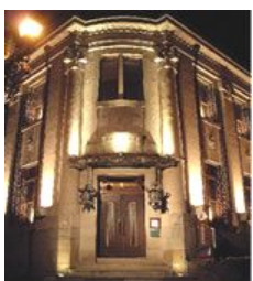
▲レトロな風格の民芸館

2010年の開催期間は 2月5日~27日 までの 毎週金曜・土曜 の8日間。場所は足湯から八千代座まで、点灯は17時半からとなります。祭りのメインである灯籠は、観光協会・商店街や地元の学生に行政などが連携して毎年数千個も製作しているそうです。素材には竹や和紙、番傘などを使用しており、 歴史的街並みを誇る山鹿の景観にもびたり! また、 大正時代の洋館を改造した山鹿灯籠民芸館 もライトアップさ