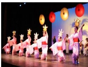
▲誰もが感嘆! 灯籠踊り

2010年の開催期間は 2月5日~27日 までの 毎週金曜・土曜 の8日間。場所は足湯から八千代座まで、点灯は17時半からとなります。祭りのメインである灯籠は、観光協会・商店街や地元の学生に行政などが連携して毎年数千個も製作しているそうです。素材には竹や和紙、番傘などを使用しており、 歴史的街並みを誇る山鹿の景観にもびたり! また、 大正時代の洋館を改造した山鹿灯籠民芸館 もライトアップさ