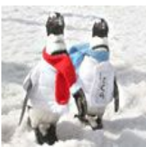
▲大佐スキー場に登場するペンギン達

冬と言えばスキーやスノーボードがベストシーズンですよね☆今までチャレンジしたいと思っていてもなかなか踏み出せなかった方もたくさんいるのではないのでしょうか？実は私もその内の一人なんです・・・(苦笑) 私も「今年こそは・・・」と意気込んでおります！皆さんもこの機会を利用して今年から始めてみてはいかがでしょうか！？